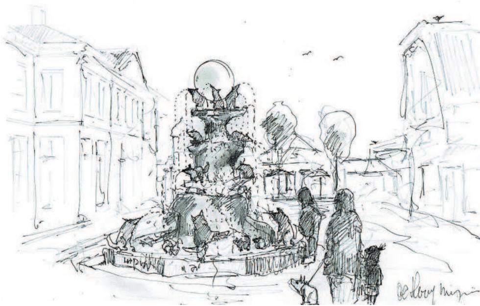
Schets van de Wolvenrots op het plein.

Op voorstel van de VVD-fractie wordt een informatiebijeenkomst georganiseerd. Daar kan dan iedereen – ook raadsleden – vragen stellen over het ontwerp van de fontein. In principe vindt de VVD het overigens verder een zaak van het college en niet van de gemeenteraad.