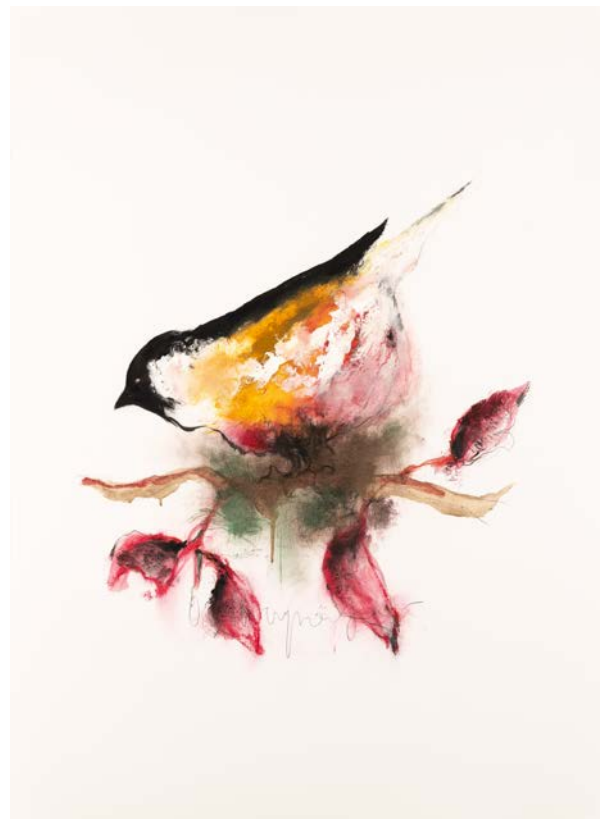
Links: Kleine Vuilbek, O.C. Hoymeijer, oliepastel op papier, 95 x 65 cm. Rechts: Aarsvink, O.C. Hoymeijer, oliepastel op papier, 95 x 65 cm