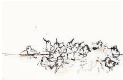
Jonge postjes met kwal

Iedere week beschrijft O.C. Hoymeyer een vogel die aan zijn brein ontsproten is.