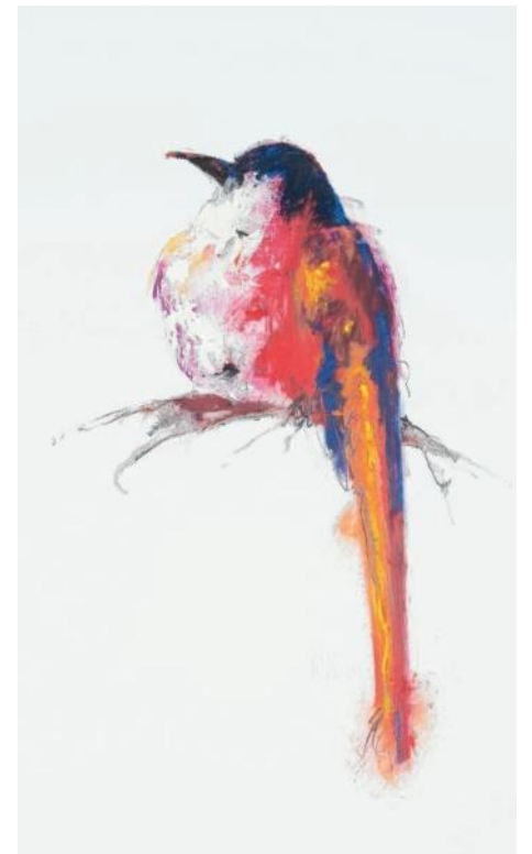
Boven: Napolitaan ( Voce napholieatheamus ). Zingt altijd van open zitplaats, een zeer melodieuze van hoog naar laag gaande melodie. Links: Zomp ( Wiegus lourdes ) Roept tijdens jaarlijkse balts een zwaar, verrekend 'zoemp-zoemp', maakt zeer treurige indruk.