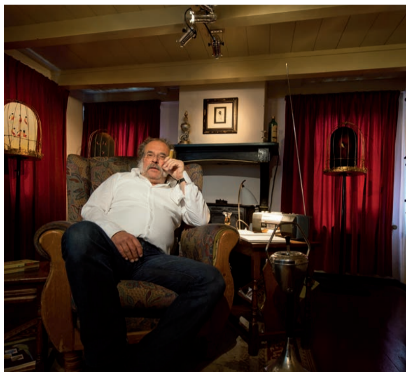
O.C. Hooymeijer.

Beeldend kunstenaar O.C. Hooymeijer (Vlaardingen, 1958) studeerde in 1981 af aan de Academie voor Beeldende Kunsten te Rotterdam. Vanaf dat moment volgden vele succesvolle exposities, zowel in Nederland als daarbuiten. Met zijn opvallende series schilderijen en tekeningen, waaronder Red Light District, Indian Portraits en Contemporary 17th Century Portraits, verwierf Hooymeijer nationale bekendheid. Zijn kunstwerk 'O.C. Hooymeijers Panorama van Amsterdam' werd in 2002 geëxposeerd door het Amsterdams Historisch Museum als onderdeel van de tentoonstelling 'Liefde te koop'. In de periode 2009-2012 maakte hij de indrukwekkende en aangrijpende series 'Misbruik', 'Katholiek Misbruik' en 'De Verering'.