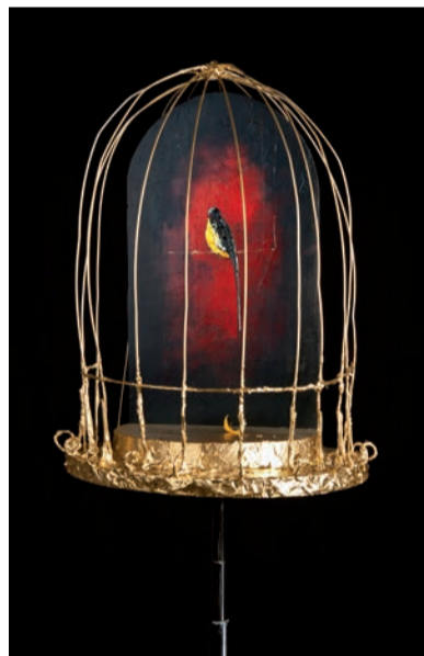
Nachtvuurbuik. Olie/mixed media, 47x40x30 cm.

een verzinner. Hij kan niet stoppen met dingen bedenken. Zelfs 's nachts gaat het fantaseren over