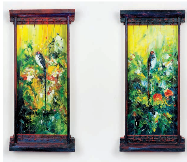
Langstaarten. Olie/paneel, 55x25 cm.

In zijn werk worden de vogels soms vermenselijkt. Helemaal duidelijk wordt dat in 'De Kleine Gids voor de