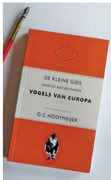
Omslag van het kostelijke boekje 'De Kleine Gids voor de niet-bestaande Vogels van Europa'.

www.ochoymeijer.com ochoymeijer@hetnet.nl